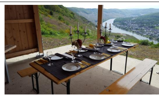
Feine rustikale Vesperplatte für 2 Pers.

Empfehlung: mit dem Moselschiff oder Bus zurück