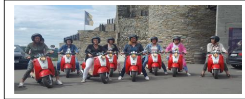
Kunden ab 15 J auf Anfrage.

Führerscheinfrei: die vor dem 1.4.1965 geboren sind.